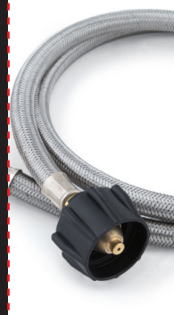
4-FT Stainless Propane Adaptor Hose

⚠ AVERTISSEMENT : Ce produit contient des produits chimiques, y compris le plomb et les composés de plomb, qui sont reconnus par l'état de Californie pour causer le cancer, les malformations congénitales ou d'autres problèmes reproductifs. Lavez-vous les mains après la manipulation. Pour plus d'informations, veuillez visiter www.P65Warnings.ca.gov .